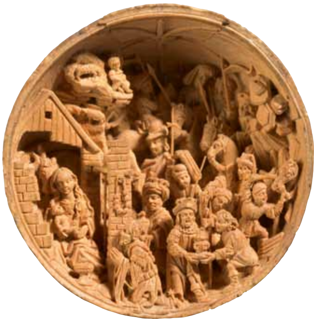
Gebedsnoot, Nederlanden, ca. 1510-1520. Buxushout gevat in zilver, diam. 4,8 cm. Amsterdam, Rijksmuseum, aankoop met steun van het Ebus Fonds, BK-2011-16.

Bedragen in vreemde valuta zijn opgenomen tegen de per balansdatum geldende wisselkoersen.