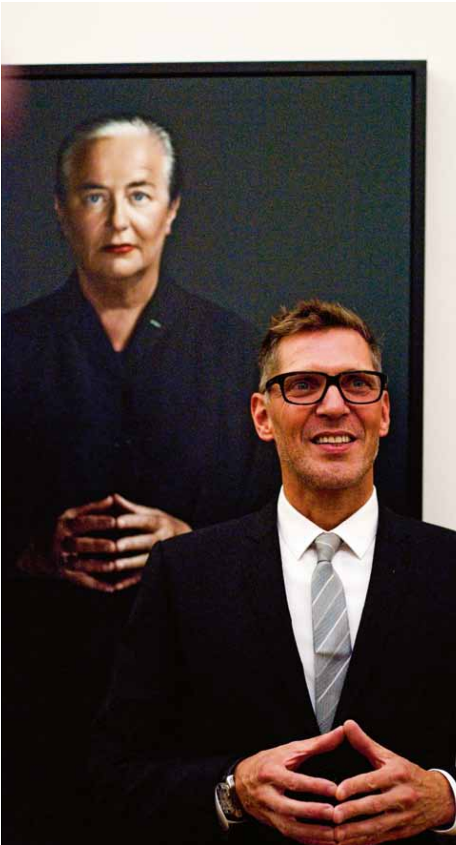
Opening van de tentoonstelling A Journey to Excellence, portretten door Erwin Olaf, 1 september 2010.

In samenwerking met het Rijksmuseum gaf Louis Vuitton de Nederlandse fotograaf Erwin Olaf de opdracht voor de tentoonstelling A Journey to Excellence . De portretten zijn een eerbetoon aan internationaal bekende Nederlanders: Dick Bruna, Hans van Manen, Janine Jansen, Johan Cruijff, Joop van den Ende, Lidewij Edelkoort en Paul Crutzen. Zij zijn allen uitmuntend op het gebied van cultuur, wetenschap of sport. De foto's zijn door Louis Vuitton aan het Rijksmuseum geschonken. Tevens ondersteunt Louis Vuitton het Rijksmuseum de komende vijf jaar op het gebied van educatie.