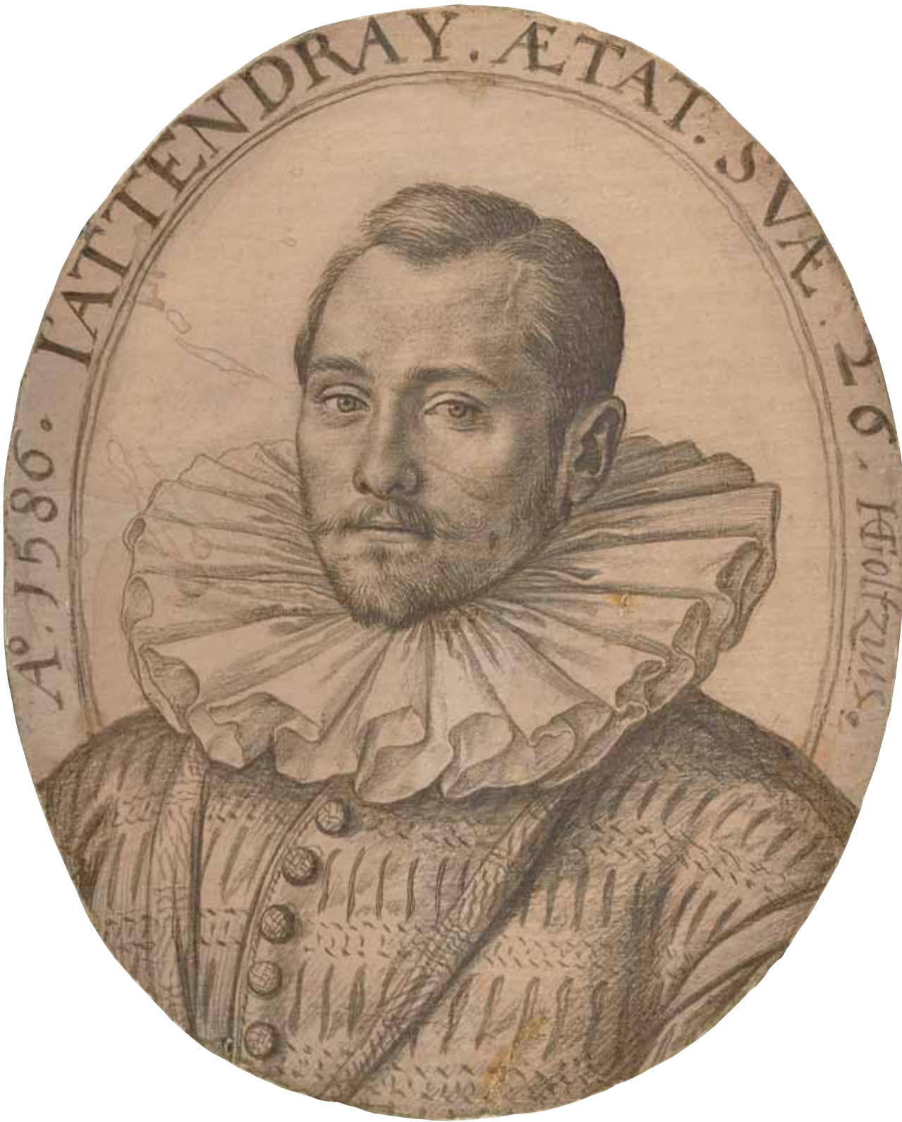
Hendrick Goltzius, Portret van een 26-jarige man , 1586. Zilverstift op geprepareerd papier, 78 x 62 mm. Amsterdam, Rijksmuseum, schenking van de erfgenen van Pieter Berend Oudemans ter voldoening van erfrecht, RP-T-2010-60.