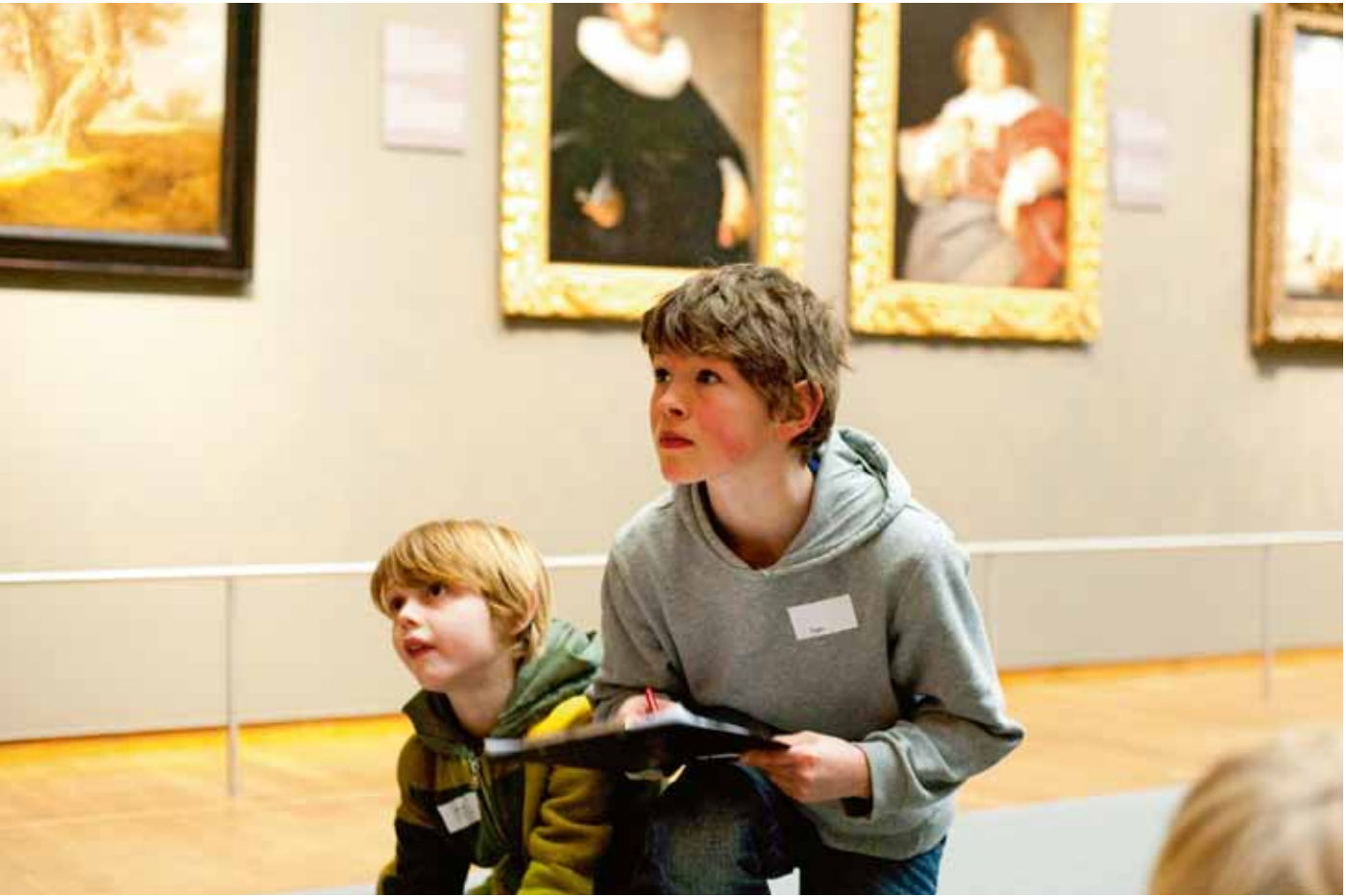
De gelabelde schenking van de Stichting Vandenbroek Foundation stelt het Rijksmuseum in staat vier jaar lang educatieprojecten gericht op jeugd en jongeren te ontwikkelen. Het canonprogramma Ij & de Gouden Eeuw is hier een voorbeeld van.

Bij Fondsen op Naam kunnen de schenkers, indien zij dat wensen, eigen beleggingscri-teria formuleren (‘Restricted vermogen’). In overleg kan maatwerk worden geleverd waarbij de schenkers mede de risicograad kunnen bepalen. Uitgangspunt hierbij is dat de inrichting van het Fonds op Naam past binnen het beleid van het Rijks-museum Fonds.