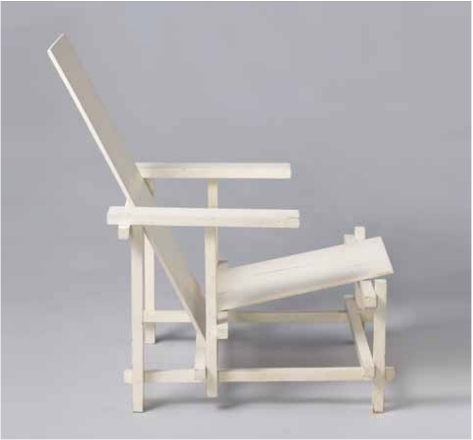
Gerrit Th. Rietveld, Leunstoel , c. 1918 (ontwerp), 1923 (uitvoering). Hout, verf, 87 x 65,5 x 84 cm. Amsterdam, Rijksmuseum, aankoop met steun van de BankGiro Loterij, BK-2010-1. © Gerrit Rietveld/Pictoright.

Meer informatie over de ANBI-status vindt u op www.anbi.nl .