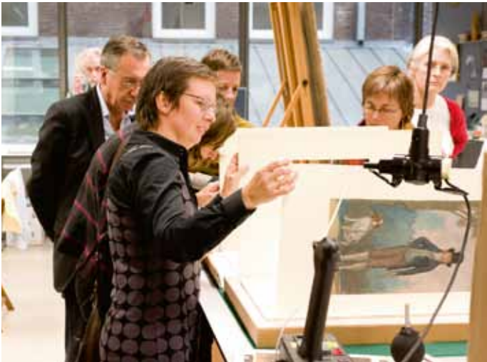
Expertmeeting over pastelconservering, november 2010, mogelijk gemaakt door het Migelien Gerritzen Fonds.