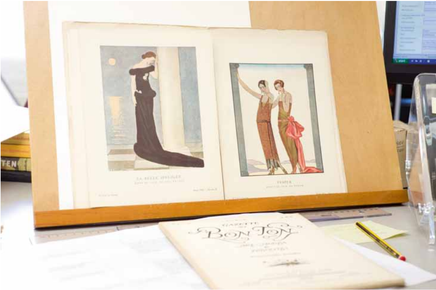
Door het project Digitale Catwalk wil het Rijksmuseum zijn ongewoon rijke verzameling kostuum- en modeprenten voor iedereen zichtbaar maken. Op de website van het museum zal deze verborgen schat