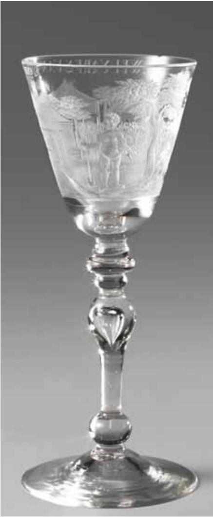
Gelegenheidsglas met een radgravure van een suikerplantage en de tekst: 't Welvaren van Siparipabo, Nederlandse graving, ca. 1725-1750. Engels of Nederlands loodglas, h. 17,8 cm. Amsterdam, Rijksmuseum, aankoop met steun van het Johan Huizinga Fonds, NG-2010-133.

Besturen en toezicht houden Het Rijksmuseum Fonds hanteert het bestuursmodel en wordt bestuurd door een onafhankelijk en onbezoldigd bestuur. Het bestuur bestaat uit tenminste vijf en ten hoogste zeven natuurlijke personen. Nieuwe bestuursleden worden benoemd door het bestuur, gehoord hebbende de hoofddirecteur van het Rijksmuseum. Bij de vervulling van vacatures in het bestuur wordt beoordeeld welke specifieke deskundigheid gewenst is. Bestuursleden worden benoemd voor een periode van vier jaar. Ieder bestuurslid kan eenmalig worden herbenoemd voor nog een periode van vier jaar.