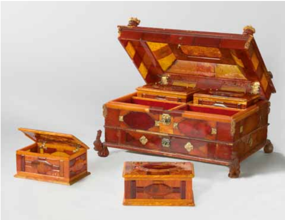
Speeldoos van barnsteen, waarin zich vier kleinere dozen voor fiches bevinden, alle gegraveerd met het alliantiewapen van Prins Willem IV van Oranje-Nassau en zijn gemalin Anna van Hannover, 1734. Barnsteen, gedeeltelijk op een houten kern, verguld

Bijdrage inzake het nieuwe Rijksmuseum € 908.000